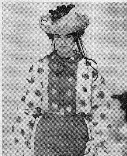
DCブランドとの提携で最新モードになった絞

の枠にとらわれない新しい動きが目立ち始めている。オリジナルブランドの開発や中国企業との合併会社の設立による積極的な企業展開……。「伝統の「財産」に甘えてばかりはいられない。若い経営者たちの取り組みに、「有松鳴海絞」の将来を見た。(正本 恭子)